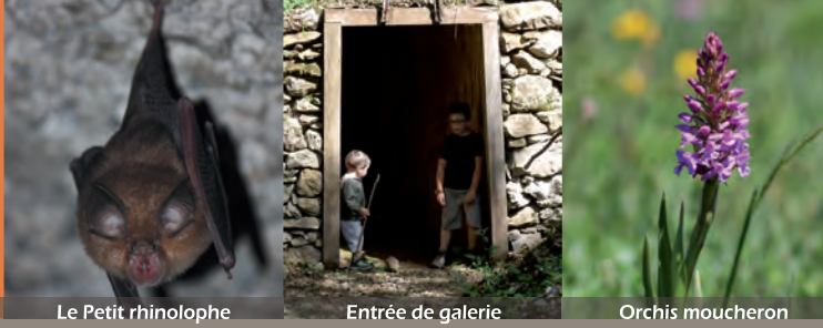
Le Petit rhinolophe

Tout au long de la balade, vous pourrez également admirer les fleurs de saison, les multiples essences de bois, ou bien encore observer les empreintes d'animaux.